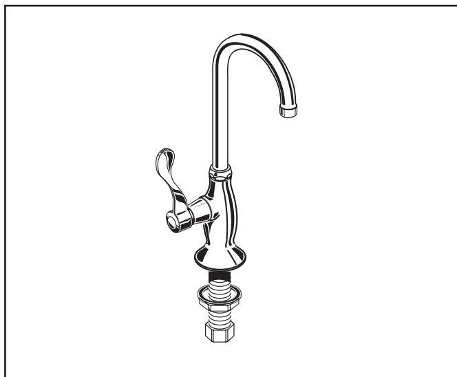
7100 271H Illustré.